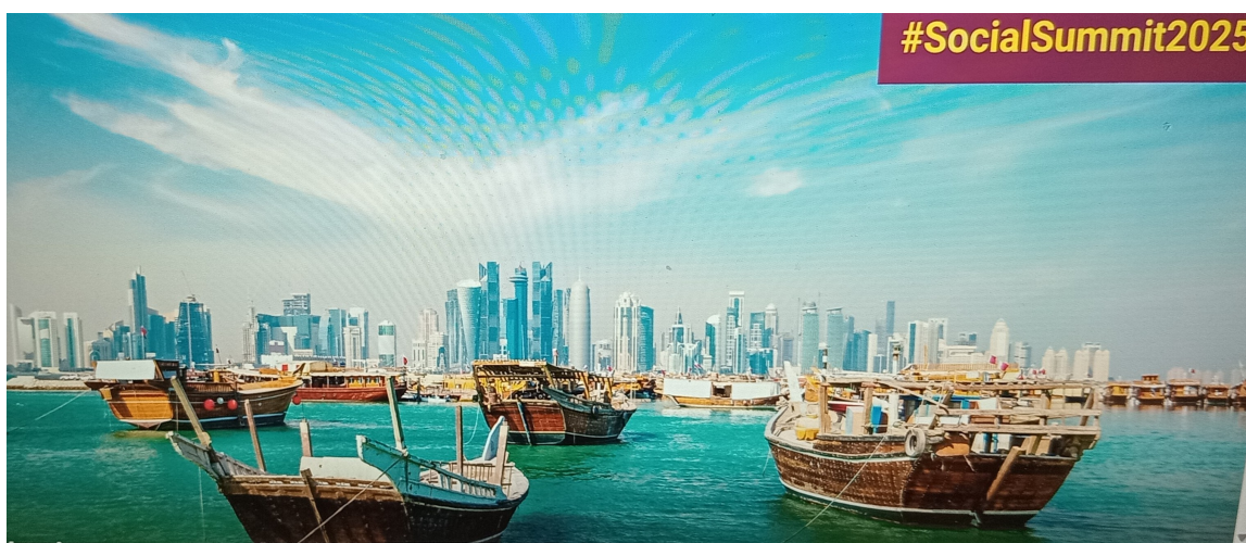
Accueil et réception des VIP pour le deuxième Sommet mondial pour le développement à Doha, Qatar

Le deuxième Sommet mondial pour le développement social s'est tenu à Doha, au Qatar, du 4 au 6 novembre 2025, marquant ainsi le 30e anniversaire du sommet historique de Copenhague. Les dirigeants du monde entier se sont réunis pour redéfinir les stratégies de progrès social, renforcer les partenariats internationaux et promouvoir des politiques inclusives favorisant l'égalité des chances pour tous. Plus de 14 000 personnes ont participé à ce sommet.