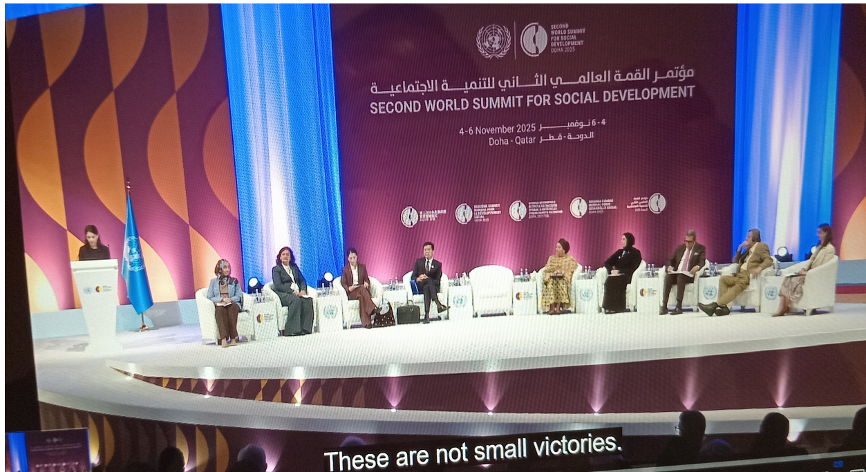
Foro de la Sociedad Civil durante la Segunda Cumbre Social para el Desarrollo. Presentación de los panelistas sobre diversos temas.