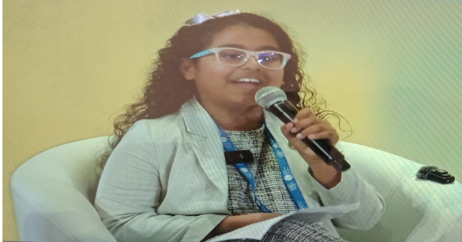
Un niño de nueve años en la Segunda Cumbre Social Mundial para el Desarrollo aboga por aquellos excluidos por las estructuras sistémicas existentes.